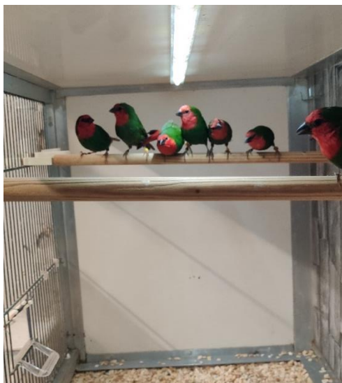
Roodkop papagaai amadines

In de 8 jaar dat ik nu met tropen kweek heb ik verschillende soorten gehad, ik vind het altijd een leuke uitdaging om te kijken of ik met verschillende soorten kan kweken. Ik ben begonnen met geelsnavel spitsstaart amadines, (foto hieronder)